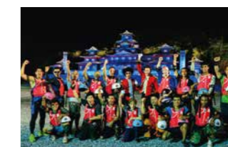
タイ版 「風雲!たけし城」

これらに加えて、アメリカでは、全米流通網の実店舗やオンラインを活用した200種類以上の商品化展開や、イギリスでは、10都市以上で、テーマパーク展開なども行われており、活動が多様化しています。